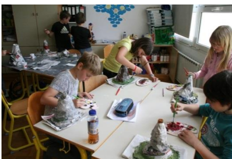
Ustvarjalci pri delu