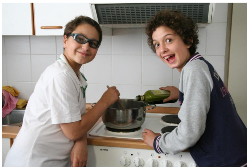
Mojstra pri delu

Začudila sem se, kje vse lahko uporabljamo določene začimbe. Najbolj me je presenetilo, da lahko v rižoto damo klinčke oz. nageljnovne žbice.