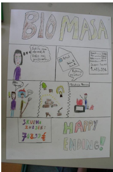
Eko plakat s srečnim koncem