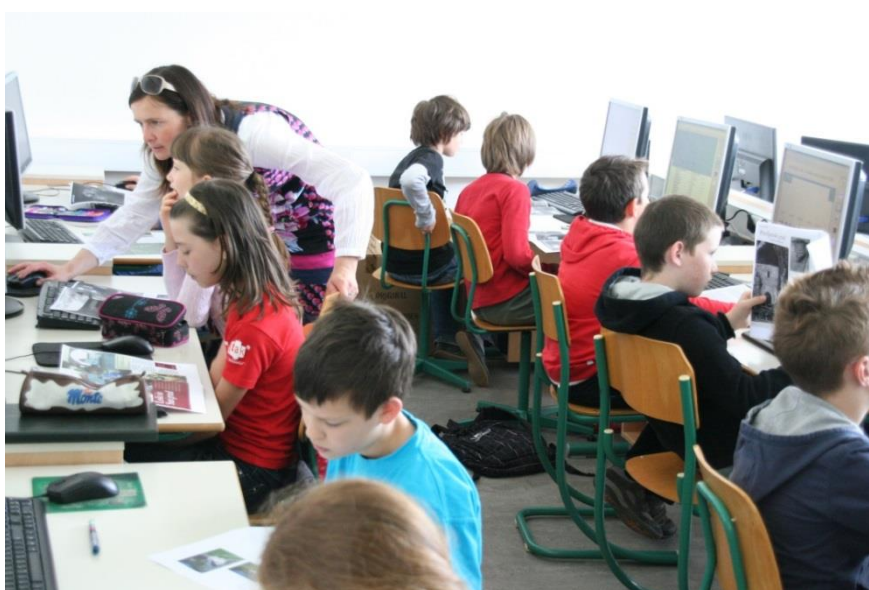
Računalniški skok v zgodovino

Všeč mi je, ker delamo z zelo dobrim računalniškim programom. Prišel sem tudi zaradi mojega nekdanjega soseda, ki sedaj hodi na OŠ Orehek Kranj in ga bolj malo vidim.