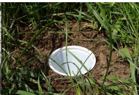
Berberjeva past za živali (vaba je vabila tako mesojedce kot rastlinojedce.

Na travniku sem ujela hrošča, kobilico in komarja. Bilo mi je všeč, želim si, da bi tudi pri pouku večkrat šli na takle „lov“ in učno uro na prostem.