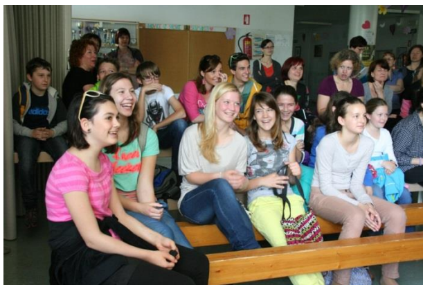
Smeh je pol zdravja