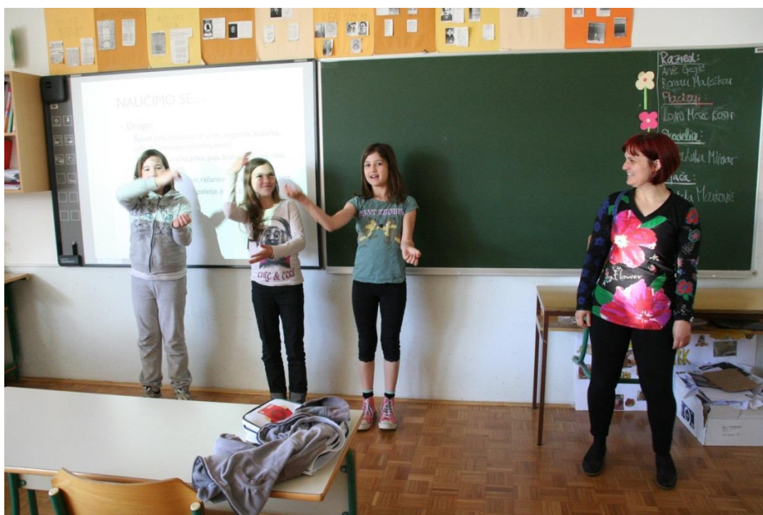
Dekleta (desno mentorica) so z veseljem pokazala, kaj so se naučile.

Zapomnila sem si kar nekaj kretenj, ki jih bodo razumeli gluhi in naglušni.