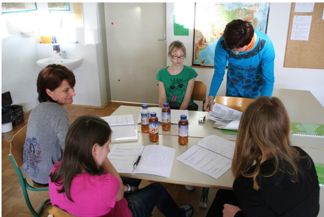
Dekleta s študijsko literaturo

Delavnica je zanimiva, sem sem se prijavila tudi zato, ker so bila še prosta mesta.